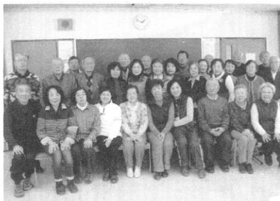
グラウンドゴルフ連盟の皆様

グラウンドゴルフ連盟は「健康寿命を伸ばすこと」を目標にして上水公園運動施設グラウンドで日頃活動をしています。競技は男女を問わず、中高年向きで、高度な技術を必要