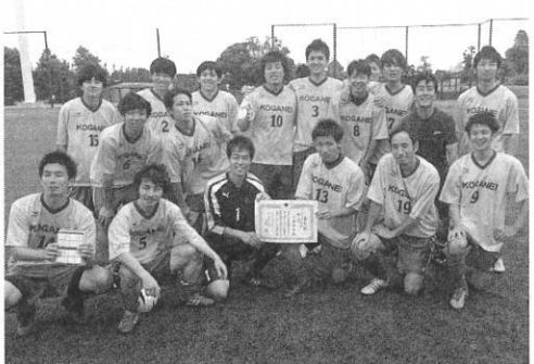
準優勝のメンバー

す。前半を0-2で折り返します。後半に入り、逆転すべく選手たちも奮闘します。しかしながら次の1点は大田区。点差がついてしまいがちな状況です。終了5分前、待望の得点ですが、2点目、3点目は奪えずそのまま試合終了。小金井市サッカーリーグ40年の歴史の中で初の決勝進出、そして準優勝。選手の皆様、スタッフの皆様、出場機会がなかった選手の皆様、お疲れ様でした。次回こそ頂点を期